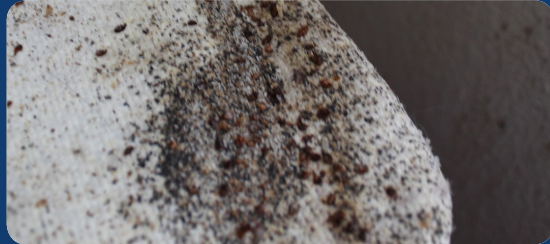
FECES AND BLOOD MARKS EXCREMENTOS RASTROS DE SANGRE