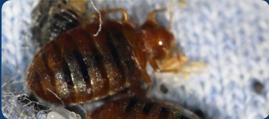
BED BUGS AFTER A BLOOD MEAL CHINCHES DE CAMA DESPUES DE ALMENTARSE CON SANGRE